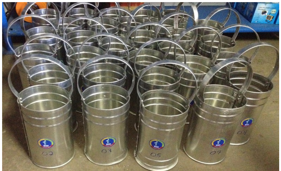
Depois - Recipiente para descartar eletrodos

A inovação e a criatividade aliada à organização, e um bom gerenciamento são uma grande mola propulsora de sucesso para uma empresa. Na busca de melhorar ainda mais nossos processos e dar mais agilidade, foi pensada durante a Parada Quente da Usina 05, a necessidade de criar um recipiente para que os soldadores substituíssem os antigos porta eletrodos