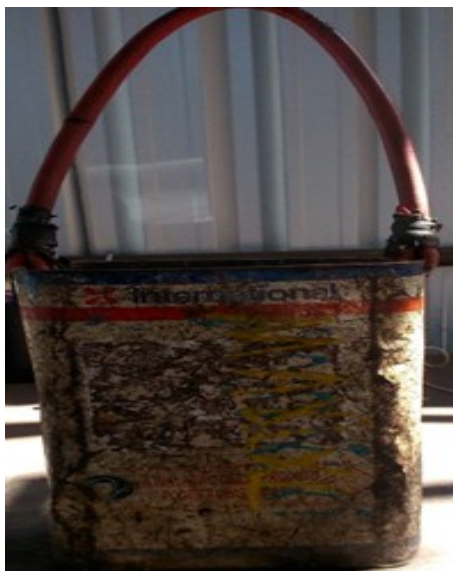
Antes - Porta Eletrodos

não adequados, para descartar as pontas de eletrodos que possuíam arestas cortantes expondo-os ao risco de corte nas mãos. Para fazer essa substituição e criação de um novo recipiente, a equipe Plamont / SESMT Vale com o apoio da coordenação do Contrato Tampão DIPE, e foram informados, que em São Luís, por exemplo, era utilizado um recipiente de madeira. Então, entraram em contato